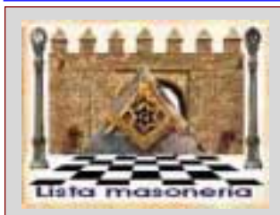
Lista [Masonería] masoneria@eListas.net