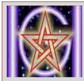
[Humanidad Global] para [Humanitas] y [humanitas 21]