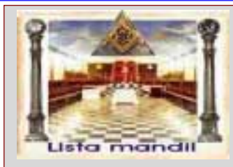
Lista [Mandil] mandil@elistas.net