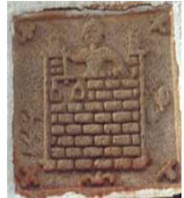
Símbolo hermético de la Villa de Oropesa

Nuestro personaje parece estar simbolizando con la balanza la de «guardián» del Reino Celestial, donde deben pesarse el bien y el mal de las almas que ascienden de nuevo al Hogar Divino, como indica un pasaje de Olimpíodoros sobre la función de Baco la divinidad griega: «El fin de los misterios, es restituir las almas en su principio, en su estado primigenio y final, es decir, la vida en Júpiter, de donde han descendido, con Baco, que allí las devuelve».