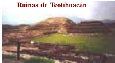
Ruinas de Teotihuacán

Otra hipótesis supone un desastre ecológico, que aumentó a sus pobladores debido al desgaste de los bosques, que se desbastaron para lograr mantener el estuco de las caras de los templos piramidales.