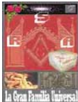
La Gran Familia Universal