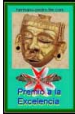
Con el apoyo difusional del Premio «Xipe Totec» del «hermano pedro»